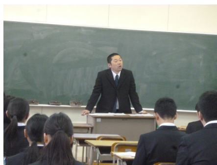
オリエンテーションの様子↑↓