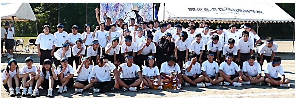
第33回体育祭 青団解団式の集合写真